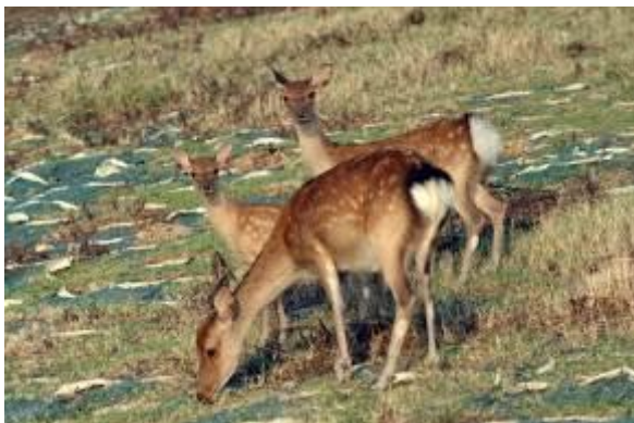
島で暮らすキュウシュウジカたち

小値賀町は、九州の西にある五島列島の北部に位置する大小17（内無人島10島）でできた島です。そのほぼ全域が西海国立公園に指定されています。気候が穏やかで風光明媚、魚介類も豊富。そしてやさしい人がいっぱい住む島。それが小値賀です。