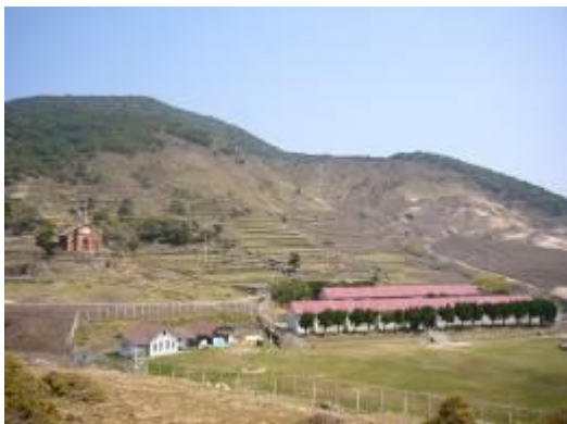
キャンプ地の野崎自然学塾村