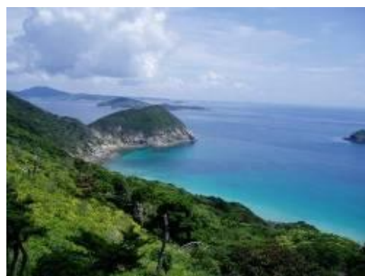
キャンプが開催される野崎島