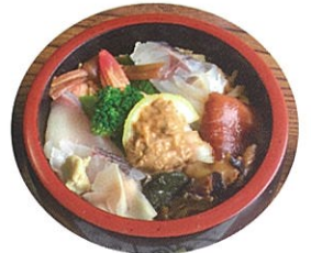
昼食 (海鮮ちらし+魚のあらの吸い物)