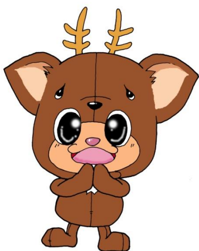
小値賀のご当地キャラクター ちかまるくん