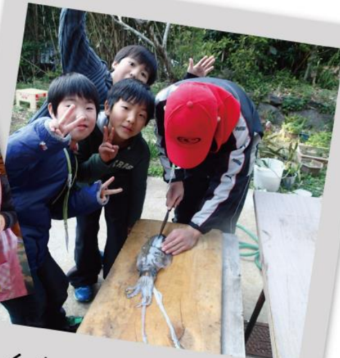
イカさばきに挑戦！