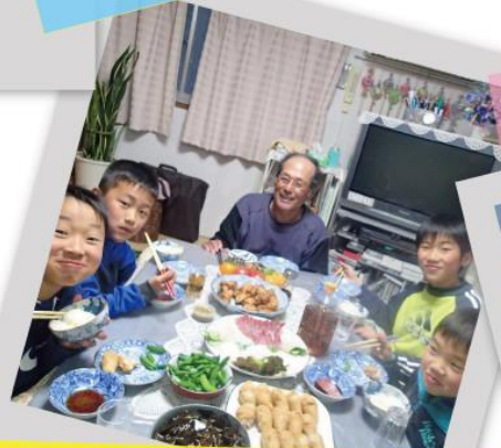
みんなでわいわい ばんごはん！