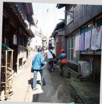
迷路みたいな、 まちなか探検