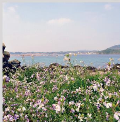
またぜったい来たくなる おぢか島！