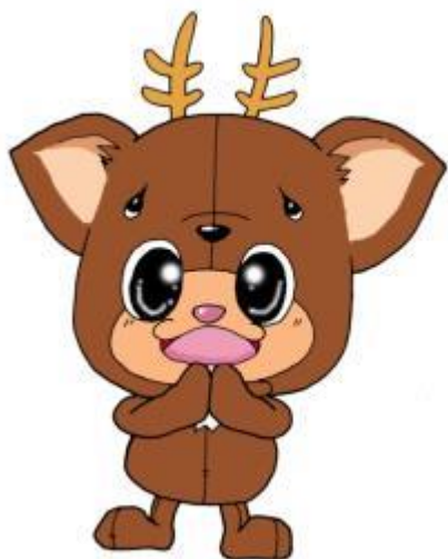
小値賀のご当地キャラクター ちかまるくん

小値賀の自然と歴史がつくった風土。 そこで織りなされる“島の人々の暮らし”を 体験できることが最大の魅力です。